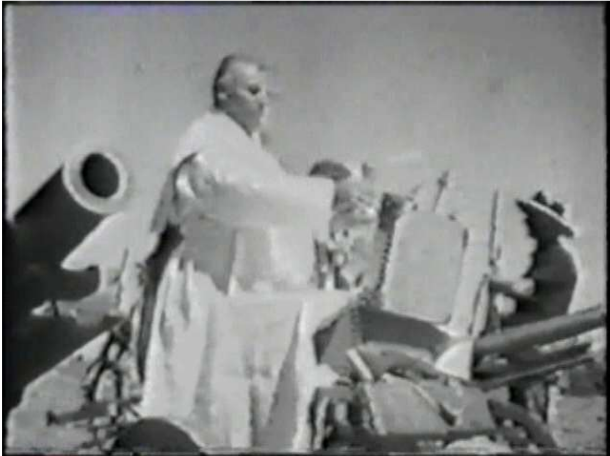
የቫቲካኑ ካሕን የፋሺስቱን ጦር ሲባርኩ

4 ኛ/ ቫቲካን የፋሺስቱን ጦር መባረካ የማይጠረጠር ሐቅ ነው። ካቶሊክ ካሕን ጦሩን ሲባርኩ የሚያሳየውን ፎቶ ከዚህ በታች መመልከት ነው፤