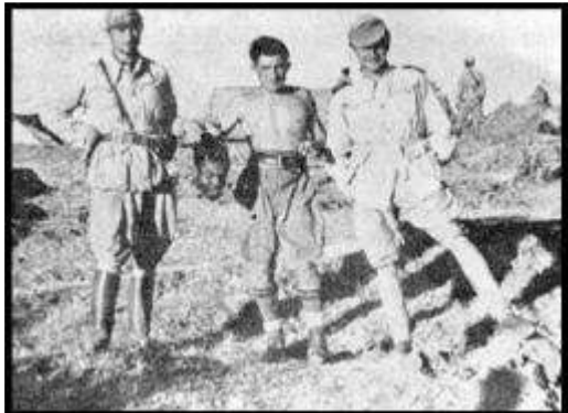
ፋሺሽቶች የኢትዮጵያዊውን ራስ ቆርጠው በፈገግታ ሲያሳዩ